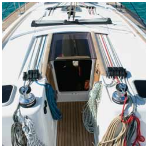
Efficace • Efficient • Funzionale • Eficacia • Funktionalität