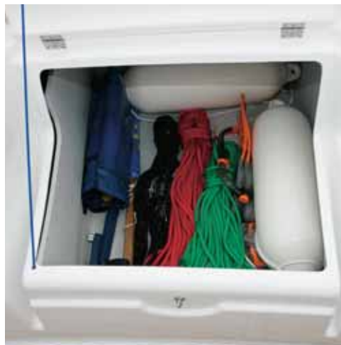
Grands coffres de rangement • Large stowage lockers • Grandi gavoni di stivaggio • Grandes cofres de estiba • Geräumige Staukisten