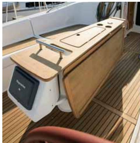
Belle et fonctionnelle* • Beautiful and practical* • Bello e funzionale* • Bella y funcional* • Schön und funktional*

Equipments - Attrezzature - Equipos - Ausstattung.