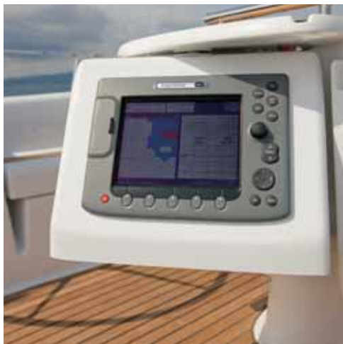
Ecran sur socle pivotant* • Screen on swivelling base* • Schermo su base girevole* • Pantalla sobre base pivotante* • Monitor auf drehbarem Sockel*