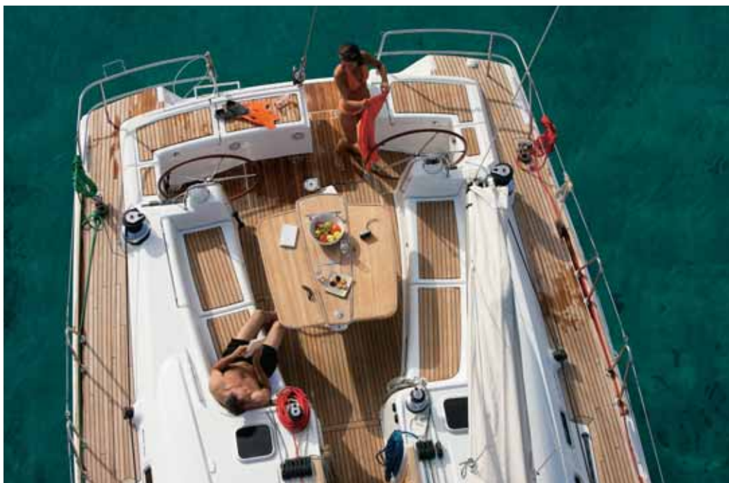
Mooring - Ormeggio - Fondeo - Ankergeschirr