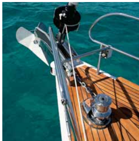
Guindeau et système de baille à mouillage inspirés des grands Yachts • Windlass and anchor well system inspired by Superyacht designs • Verricello e gavone ancora ispirati al concetto dei grandi Yachts • Molinete y sistema de pozo de anclas inspirado en grandes yates • Ankerwinde und Ankerpiek wie bei einer Großyacht

* Option - Optional - Opzione - Opcional - Option