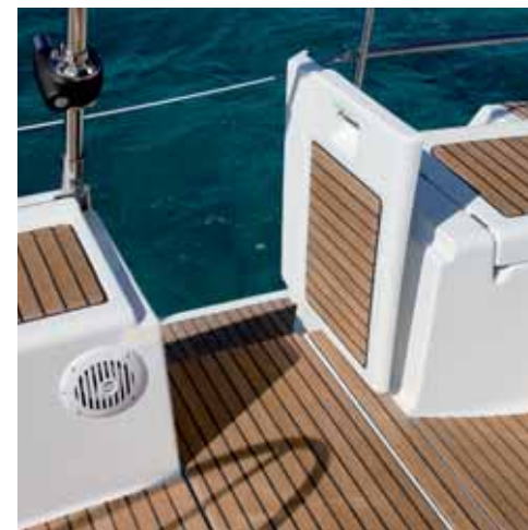
Circulation • Freedom of movement • Circolazione • Circulación • Bequemer Zugang

* Option - Optional - Opzione - Opcional - Option