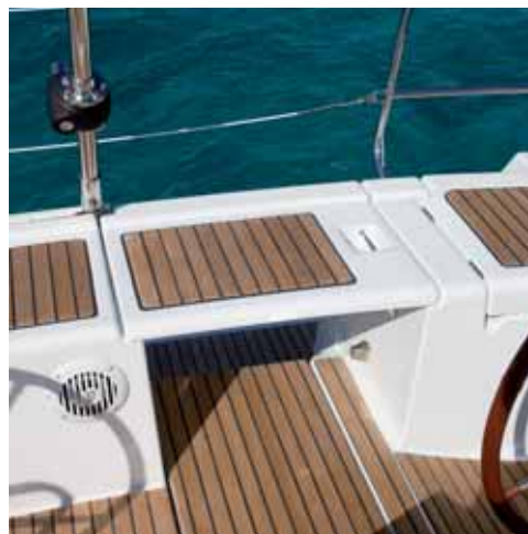
Protection • Protection • Protezione • Protección • Schutzbezüge