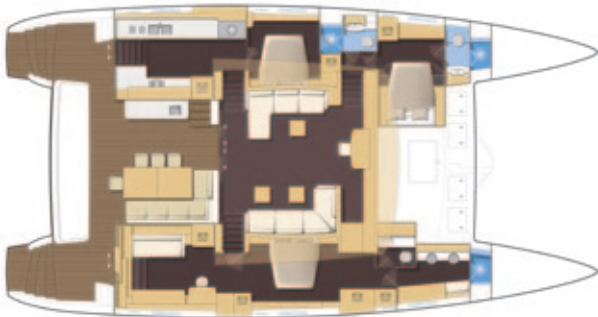
Cuisine latérale / Lateral galley - Version propriétaire 3 cabines - Owner's version, 3 cabins.