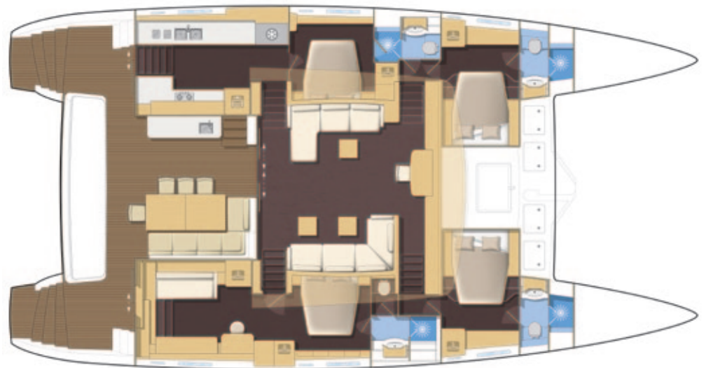
Cuisine latérale / Lateral galley - Version propriétaire 4 cabines - Owner's version, 4 cabins.