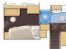
Cabine centrale bâbord, 2 couchettes superposées Port center cabin with 2 superimposed berths