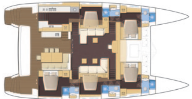
Cuisine latérale / Lateral galley - Version 5 cabines - 5 cabin version.