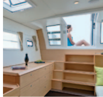
01 - 02