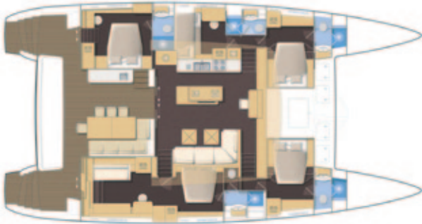
Cuisine centrale / Central galley - Version propriétaire 5 cabines - Owner's version, 5 cabins.