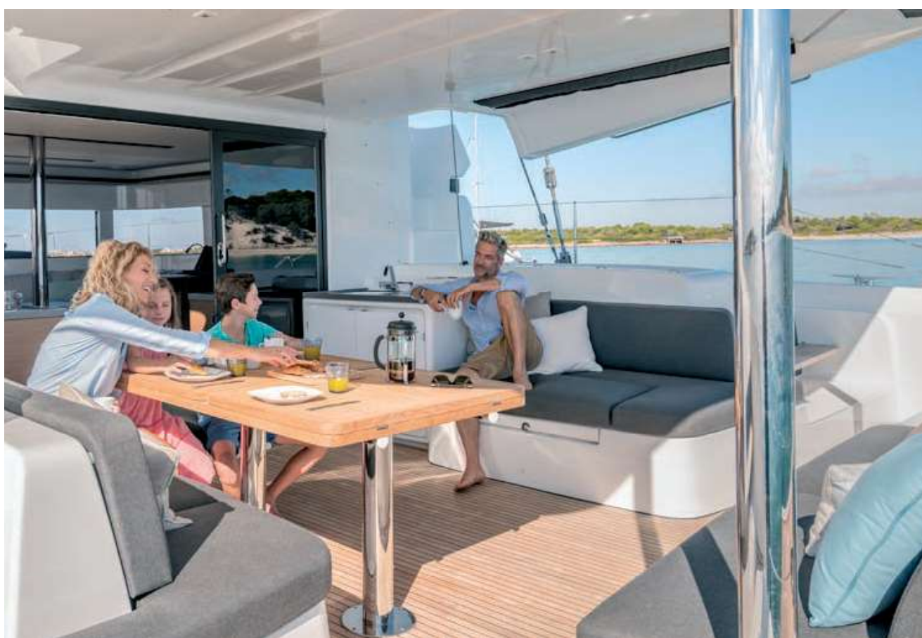
Table XXL accueillant jusqu'à 12 convives, cuisine d'extérieur équipée, le cockpit du Lagoon 50 maximise le confort. De plain-pied avec le carré aux vitrages généreux, il garantit la vision panoramique tout en offrant une protection maximale. Un must !