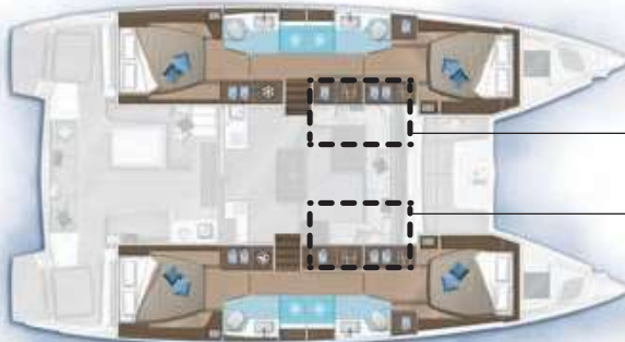
4 cabines, 4 salles d'eau / 4 cabins, 4 bathrooms

OPTION Dressing à tribord Dressing on port