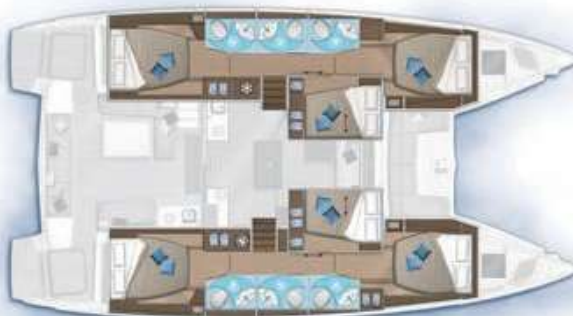
6 cabines, 6 salles d'eau / 6 cabins, 6 bathrooms

OPTION Cabine à tribord ou à bâbord Cabin on starboard or port