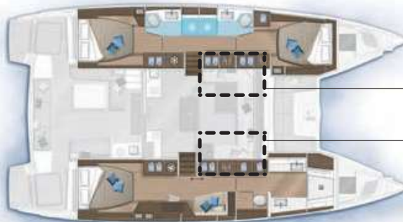
3 cabines, 3 salles d'eau / 3 cabins, 3 bathrooms