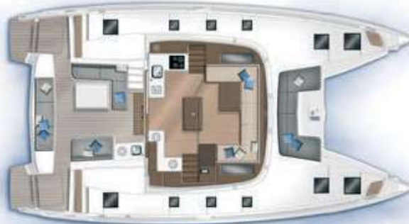
Carré et cockpit / Saloon and cockpit

The 50 with her various layouts offers to the owner many choices to customize his/her boat: dressing, additional cabin on starboard or port ... A modularity unique in this size of boat.