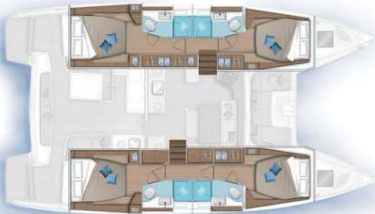
4 cabines, 4 salles d'eau / 4 cabins, 4 bathrooms