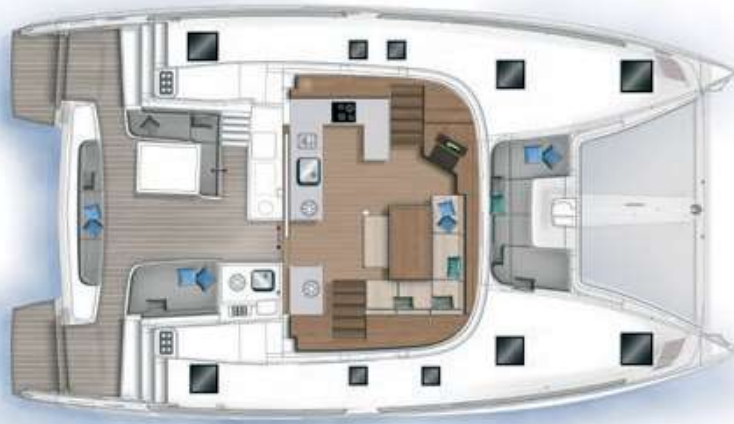
Carré et cockpit / Saloon and cockpit