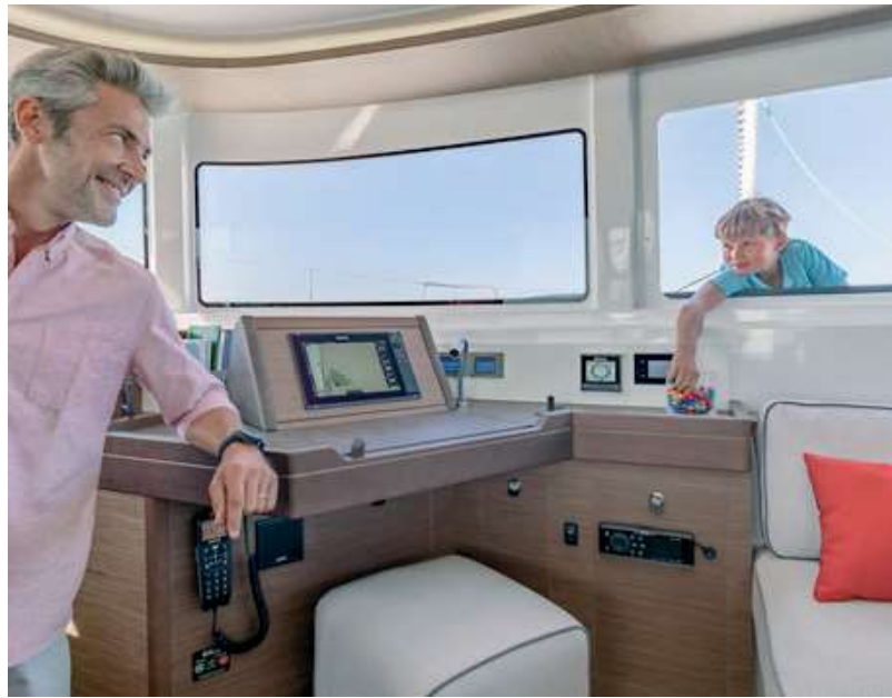
VITRAGE COULISSANT OUVERT. SLIDING SASH WINDOW OPENED.