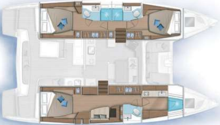
3 cabines, 3 salles d'eau / 3 cabins, 3 bathrooms