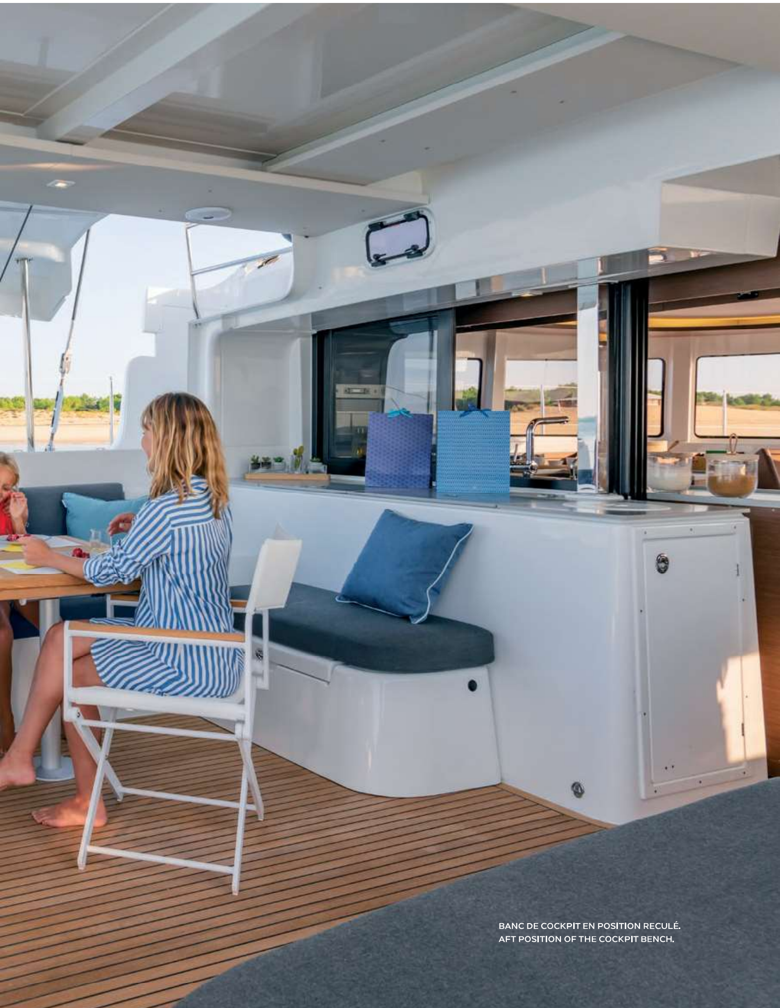
BANC DE COCKPIT EN POSITION REÇULÉ. AFT POSITION OF THE COCKPIT BENCH.