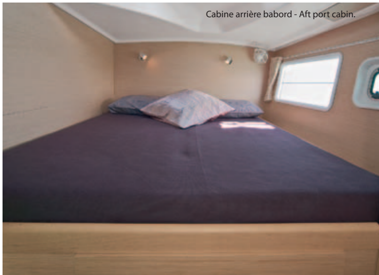
Cabine arrière babord - Aft port cabin.