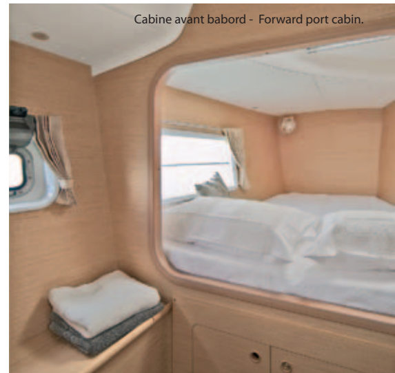
Cabine avant babord - Forward port cabin.