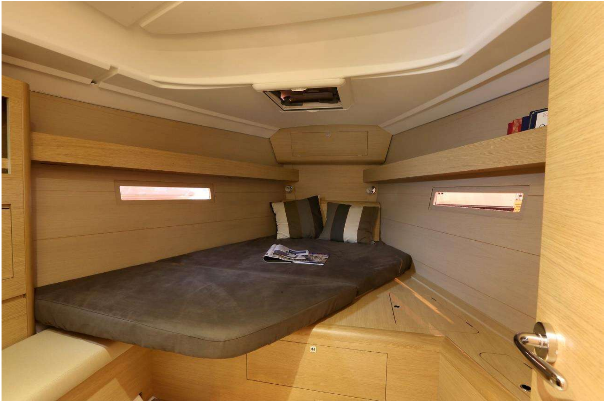
DUFOUR 410