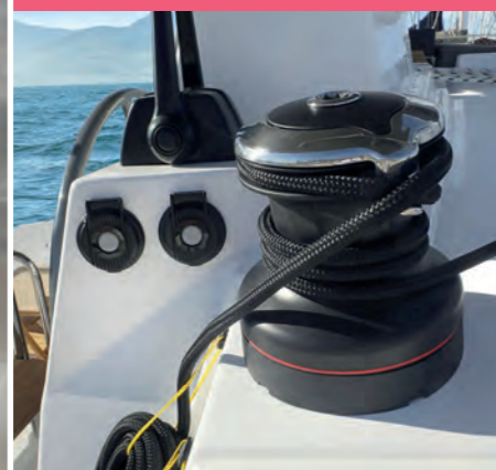
2 Electric winch Winch électrique