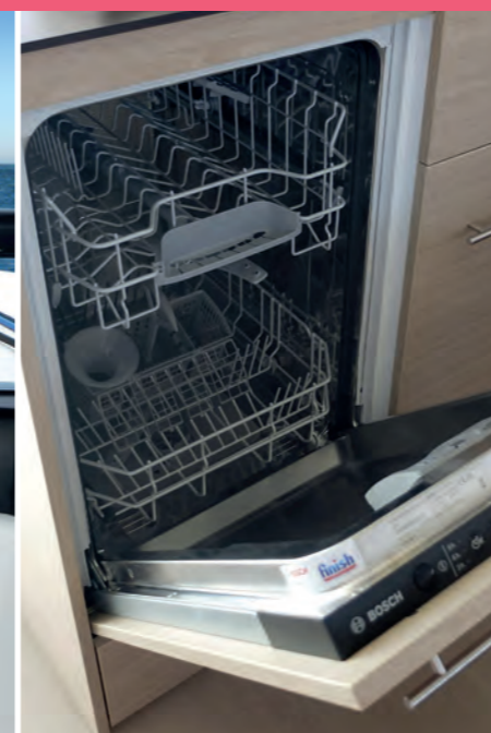
4 Dishwasher Lave-vaisselle