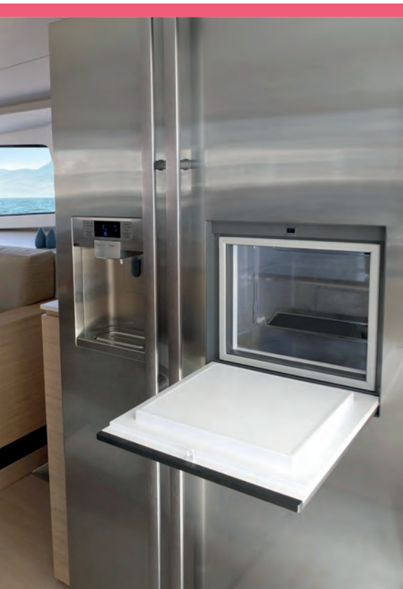
1 American fridge with ice-maker Réfrigérateur américain et distributeur de glaçons

Some of the best chandlers, riggers and deck equipment suppliers have been involved in the BALI 4.5 Open Space, providing innovative solutions, tested both in the lab and at sea, to give you the best their technology.