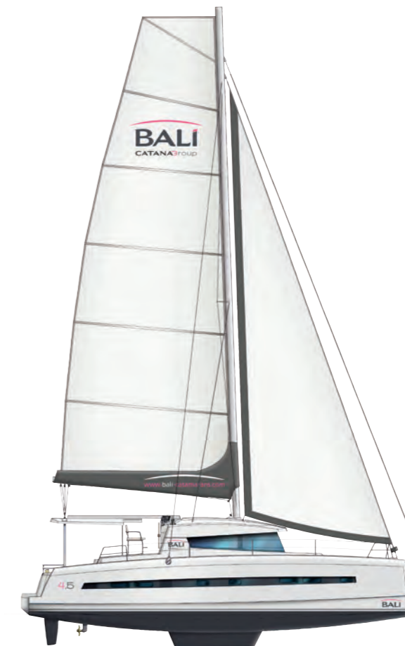
Pilot station «BIMINI» version Version poste de barre «BIMINI»