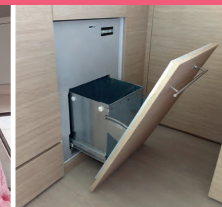
6 Waste compactor Compacteur à déchets