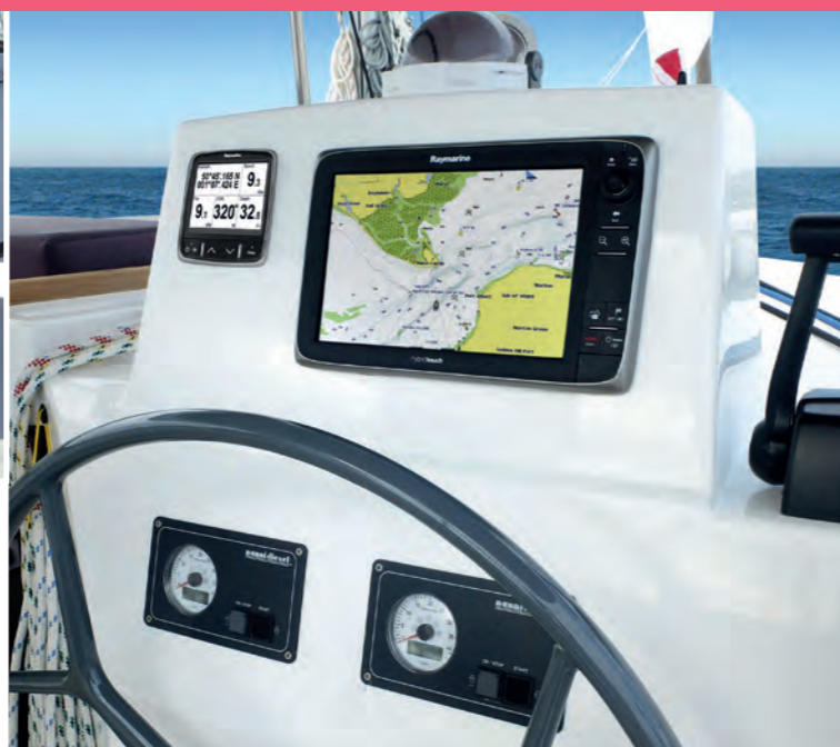
3 Full electronic equipment - composite steering wheel Electronique complète - Barre composite