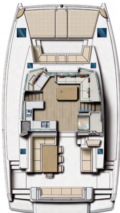
Platform Layout Plan de Nacelle