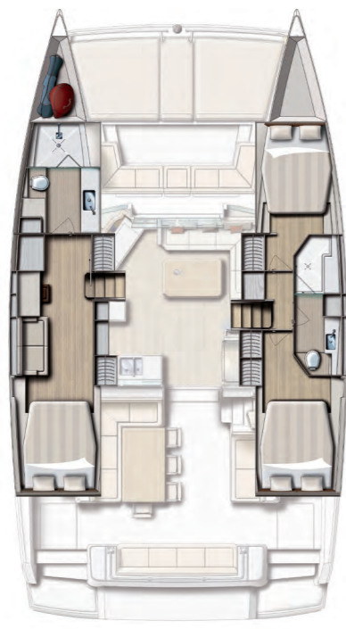
3 cabin version / 2 bath version Version 3 cabines / 2 SDB