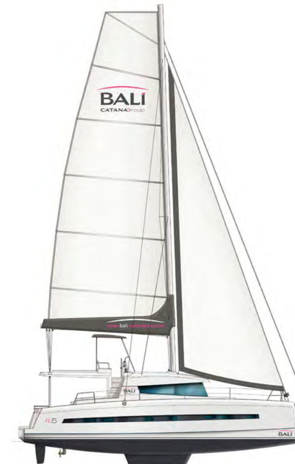
Pilot station «on the flybridge» version Version poste de barre «sur le flybridge»